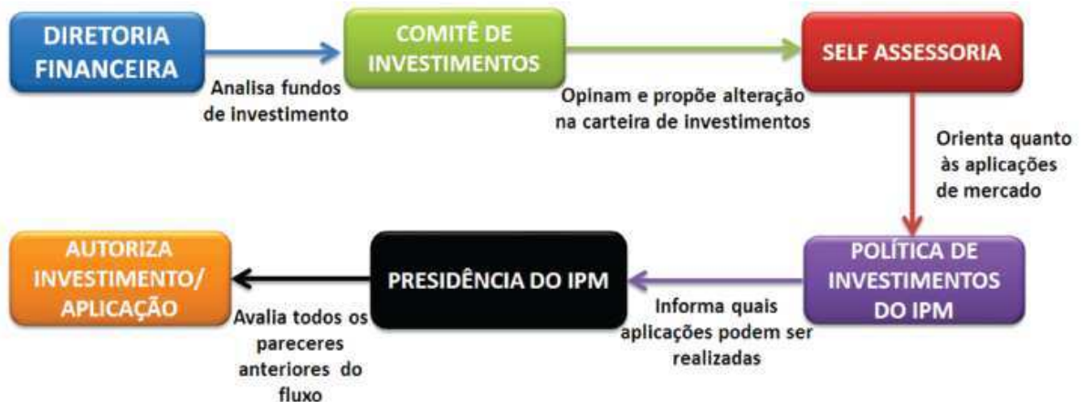
Figura 3: Atual fluxo de investimentos/aplicações do IPM