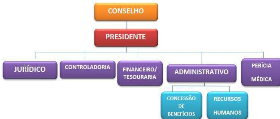
Figura 2: Organograma