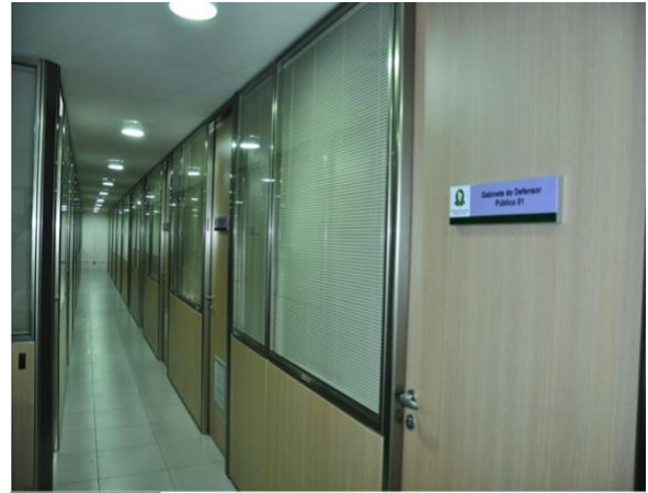
Figura 3 - Gabinetes dos Defensores Públicos