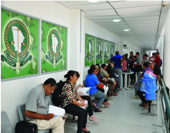
Figura 2 – Defensoria Pública Unidade Fórum