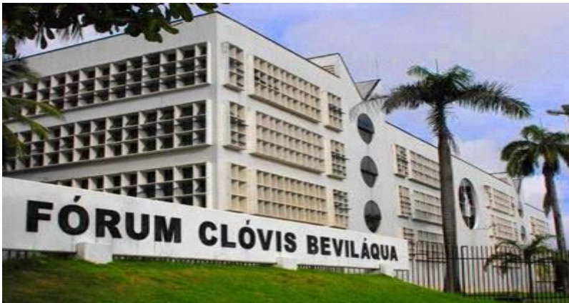
Figura 1 – Fórum Clóvis Beviláqua

Para uma maior compreensão, busca-se através de imagens como recurso de informações detalhadas a fim de transmitir a ideia de localização da unidade Defensoria Pública localizada na área interna do Fórum Clóvis Beviláqua.