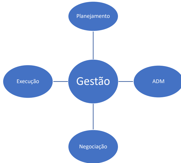
Figura 2 - Categorias gestão de saúde