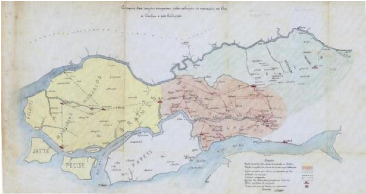
Figura 3 - Regiões ocupadas pelas colunas de operações ao Oio, Cacheu e os Balantas 7

Fonte: Arquivo Historico Ultramarino. Croquis das regiões ocupadas pelas colunas de operações ao Oio, a Cacheu e aos balantas.- Escala de 1 / 250 : 000.- [Guiné] : [s.n.], [ca. 1914].- 1 mapa : papel empastado em tecido,color. , ms. ; 39,5 x 64 cm. Anexo a AHU-MU-DGC-R Militar-Gerais, cx. 11, “relatório de operações ao Cacheu, de 1914, Agosto, 10, (1911-1915) 1L Guiné / Oio / Cacheu / Balantas / Operações militares / Mapa político / [ca. 1914]. PT/AHU/CARTM/049/01333.: agosto, 1914.