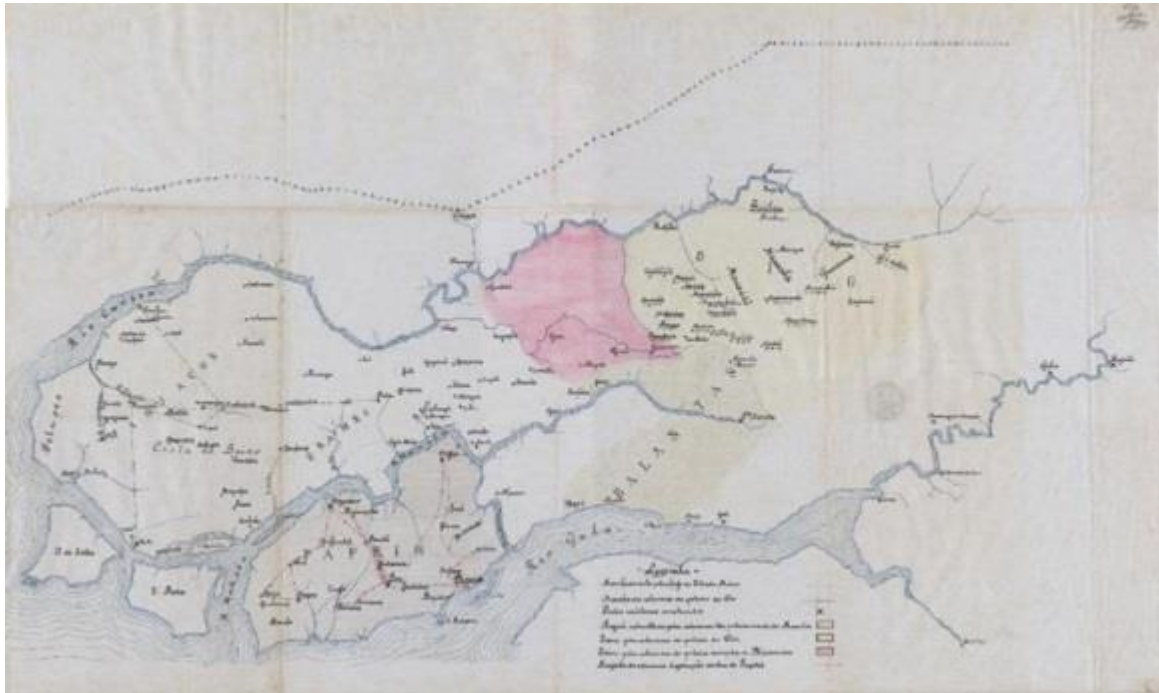
Figura 4 - Operação Militar contra Pepel e os Grumetes de Bissau 14

hostil, portanto, quando os europeus chegaram alguns optaram por se juntar aos europeus para se beneficiar nas lutas contra seus inimigos.