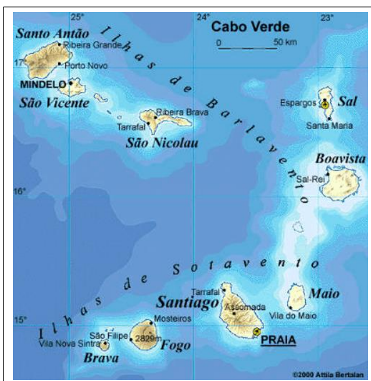
Mapa com as ilhas do barlavento e do sotavento

defendida em 2014 na Universidade de Brasília (UnB) 2 . Verifica-se desde o início que a pesquisa se concentrou em uma das dez ilhas do arquipélago, a Ilha de São Vicente, localizada mais precisamente entre as ilhas do grupo do barlavento, portanto, se juntada à pesquisa de Rodrigues exposta anteriormente, que se dedicou à cidade da Praia, capital do país, situada na Ilha de Santiago, no conjunto de ilhas do sotavento, a junção pode nos dar um quadro mais complexo da população LGBT em Cabo Verde. Para melhor compreensão da localização das ilhas citadas, segue o mapa abaixo: