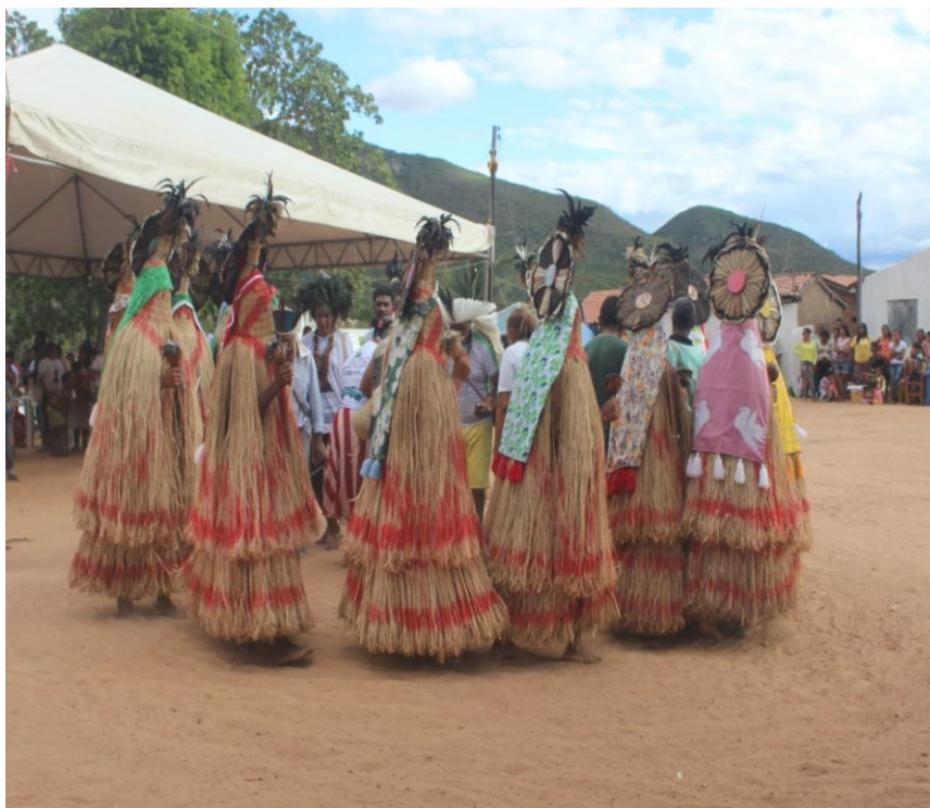
Imagem 02: Orítual dos 'praiá' Pankararú.