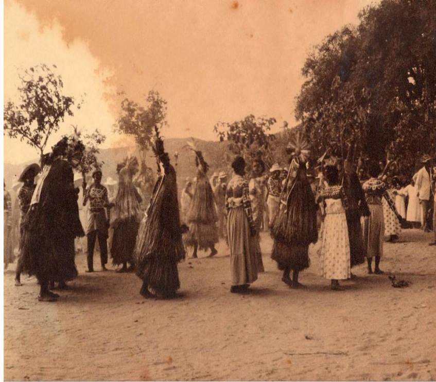
Imagem 03: Celebração Pankararu em 1937, foto de Carlos Estevão. Fonte: https://portal.aprendiz.uol.com.br/2018/07/16/contra-invisibilidade-da-populacao-indigena-educadorleno-vidal-propoe-ligacao-entre-arte-e-territorio/