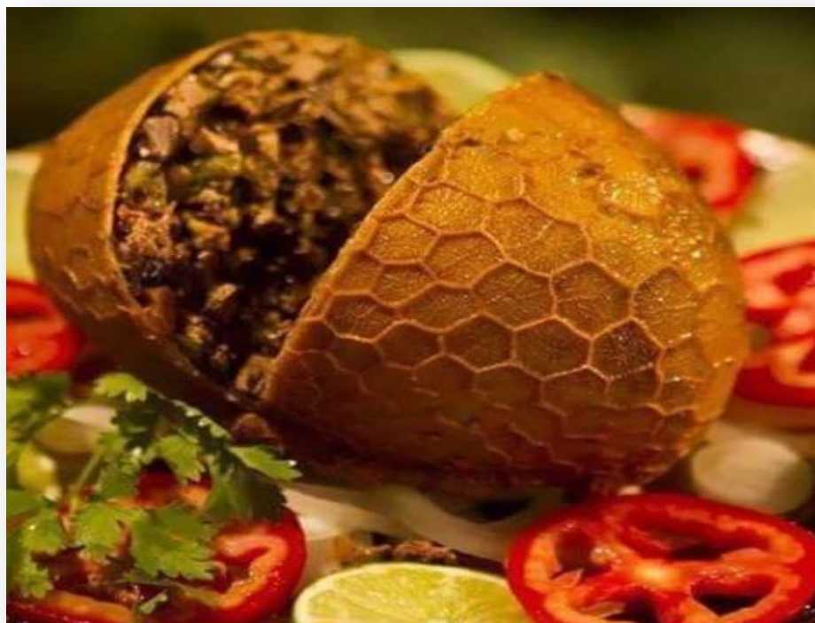
Foto 5. Imagem ilustrativa da Buchada. Fonte Site: https://www.google.com/search?biw=1347&bih=591&tbm=isch&sxsr=ACYBGNRL4NQHrkly2mPO_Es_yGsmLFA8DA%3A1579992430067&sa=1&ei=bsUsXrPgA42j5OUPluWhqAE&q=buchada&oq=bucha&gs_l=img.1.1.0i67j0i9.69225.76322..79392...4.0..4.1457.66.31.0j3j1j2j2j3j0j2.....0....1..gws-wiz-img.....10..35i39j0i24j35i362i39j0i19j0i10i19j0i30i19j0i5i10i30i19.AWShLsSn0yQ#imgrc=fkEvrJ5F8BQ-vM: Acesso em 20/12/2019 às 10h30min.