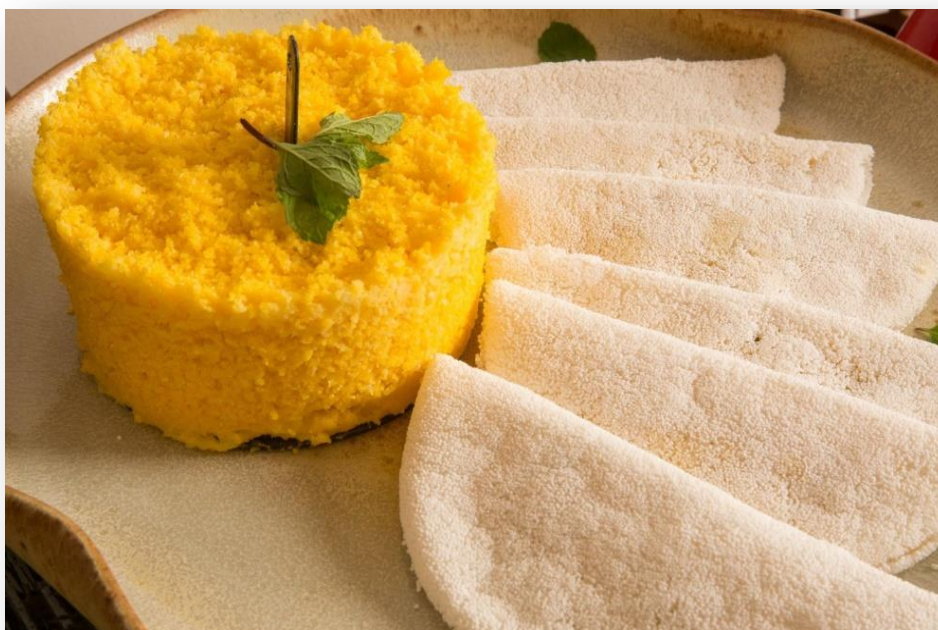
Foto 4. Imagem ilustrativa do Cuzcuz e da Tapioca. Fonte Site: https://www.google.com/search?biw=1347&bih=591&tbm=isch&sxsr=ACYBGNRB9Z2IknnRggwqnxwLvtMVAD4TKA%3A1579992511709&sa=1&ei=v8UsXuLuKva_5OUP35CM4A4&q=cuzcuz&oq=c&gs_l=img.3.0.35i39i2j0i67i8.276596.276596..279127...1.0.0.206.573.0j2j1.....0....1..gws-wiz-img.....0.CihDvZcMe0o#imgrc=liqTU9o_rQVzQM: Acesso em 19/12/2019 às 21h20min.