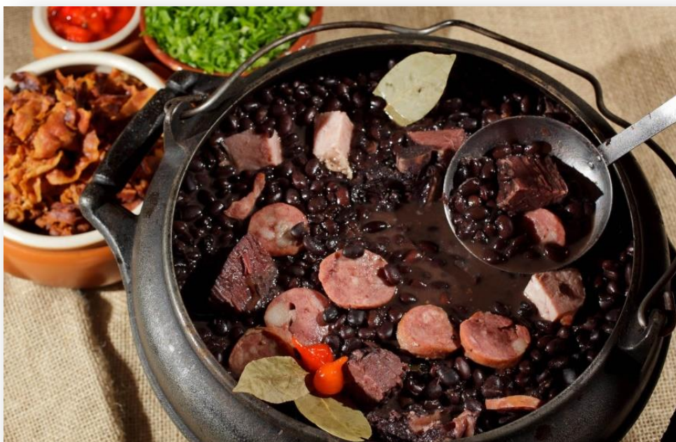
Foto 2. Imagem ilustrativa da Feijoada. Fonte Site https://www.google.com/search?q=feijoada&sxsr=ACYBGNSSNw3pwzFHPgyw3rsSZcfNREHurA:1579991712734&source=Inms&tbm=isch&sa=X&ved=2ahUKewiZi6Tm55_nAhWMDrkGHQhUAS4Q_AUoAXoECBEQAw&biw=1347&bih=640#imgrc=RkYSesg0xoBbiM Acesso em 19/12/2019 às 20h12min.