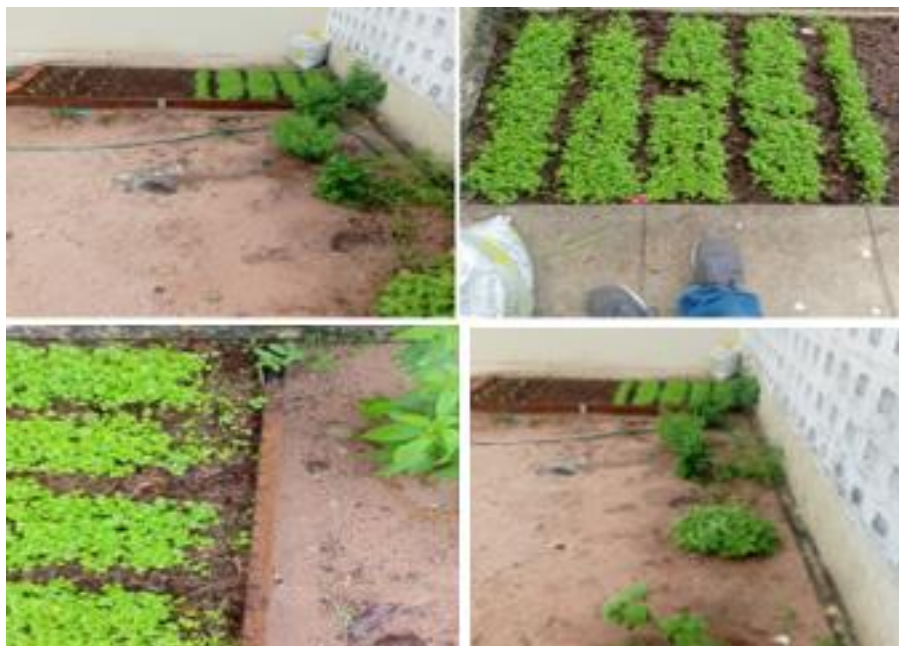
Figura 11 - Horta escolar da escola Olímpio Nogueira Lopes

Outro importante momento de troca de experiências pode ser visualizado na figura 12, que ilustra a visita de um grupo composto pela pesquisadora, orientadora e mais dois pesquisadores, vinculados ao PPPGE-UECE e ao curso de agronomia da UNILAB.