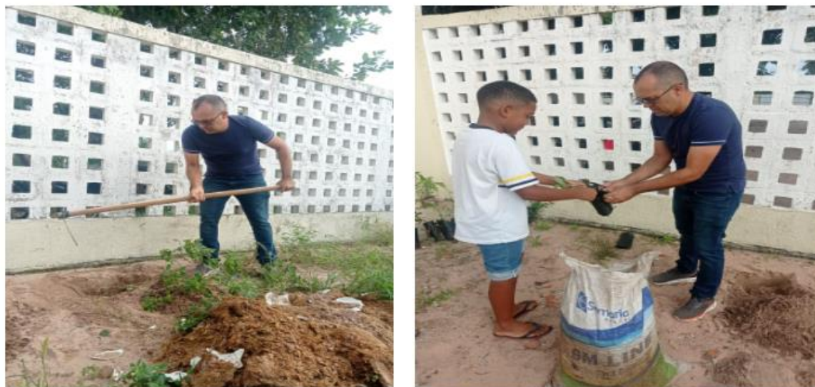
Figura 10 - Organização da horta da Escola Olímpio Nogueira Lopes

A Figura 10 apresenta um dos professores da escola organizando o canteiro da horta e um aluno, dando início ao projeto Horta Escolar.