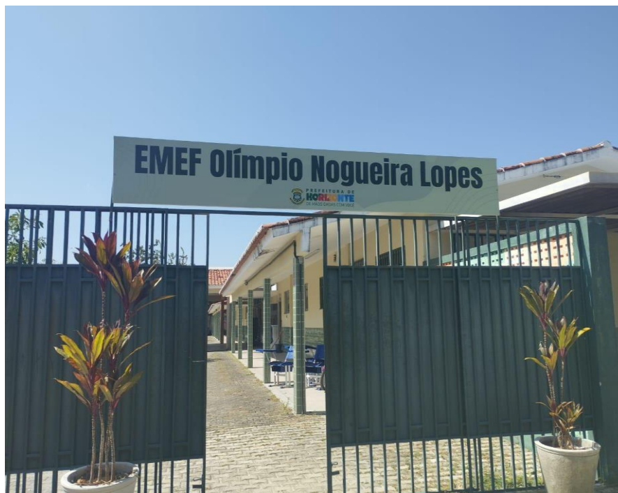
Figura 6 - Fachada da Escola Quilombola Olímpio Nogueira Lopes

acesso à escola é fácil, com grande parte das ruas pavimentadas, e todos os alunos chegam a pé, pois moram na redondeza (HORIZONTE, 2017).