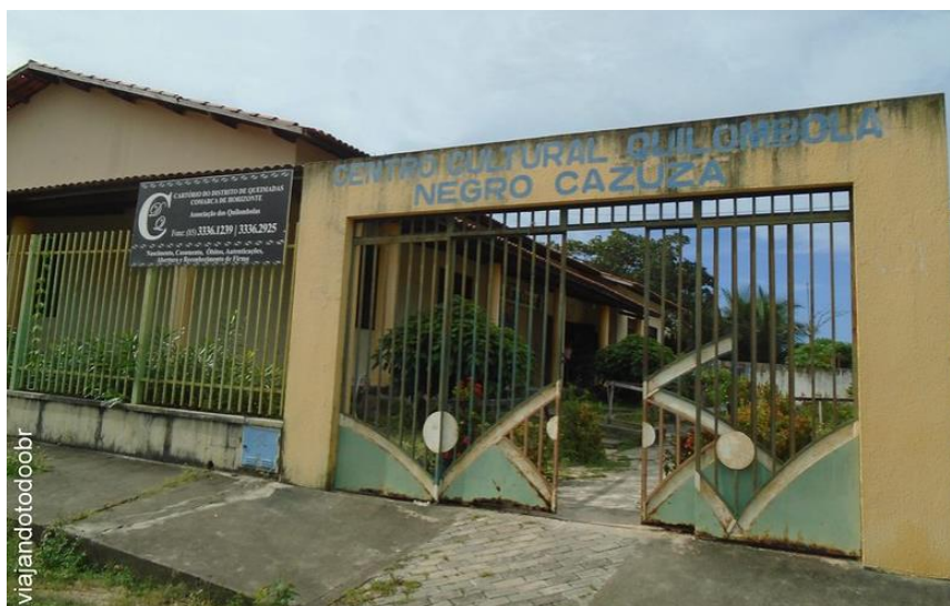
Figura 4 – Centro Cultural Quilombola Negro Cazuzá

Na comunidade quilombola de Alto Alegre contamos com a presença de uma Unidade da Estratégia de Saúde da Família; um Centro de Educação Infantil; duas Escolas de Ensino Fundamental e uma Escola de Ensino Médio. Além dessas estruturas, verificamos, ainda, a presença de um Centro Cultural Quilombola Negro Cazuzá; uma sede da Associação Comunitária e um Museu de Memórias.