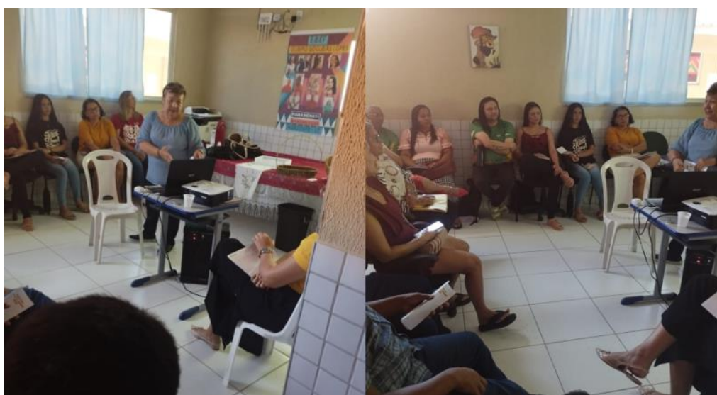
Figura 07 - Sensibilização e Apresentação do projeto

A terceira visita ocorreu no dia 31 de julho, durante a qual participei do planejamento pedagógico junto aos docentes. A maioria dos professores estava concentrada no planejamento das ações didáticas para o segundo semestre. Nesse encontro, foi apresentada a proposta de pesquisa sobre Horta Escolar, destacada como um instrumento de resgate e valorização dos saberes tradicionais, por meio da sensibilização promovida pelo projeto.