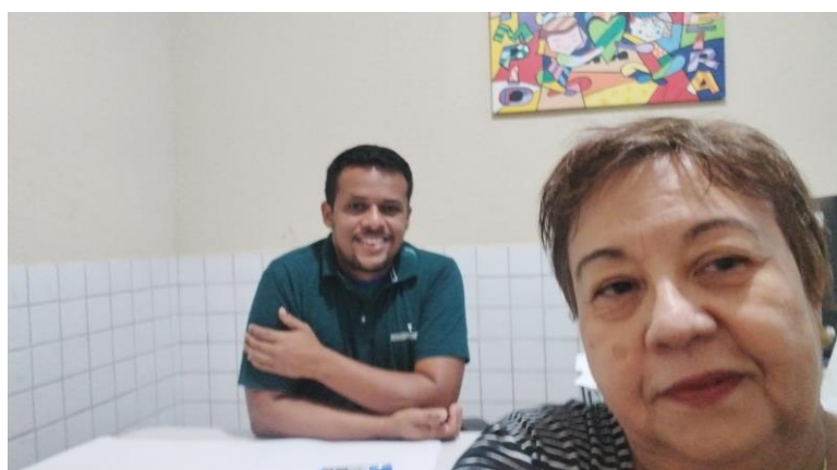
Figura 07 - Gestor da Escola Olímpio Nogueira Lopes

A primeira visita ocorreu dia 06 de março de 2024 como forma de conhecer a escola e realizar o primeiro contato com a gestão escolar, apresentando de maneira pessoal, a proposta de pesquisa ao gestor, tendo em vista que este processo já havia sido realizado anteriormente, através de contatos telefônicos. A Figura 07 apresenta o momento da conversa com o gestor da escola. Este professor expressou com muito orgulho o fato de ser filho de Horizonte e voltar para a escola como gestor após anos atuando como trabalhador de fábricas. Este movimento fez com que se apaixonasse pela educação.