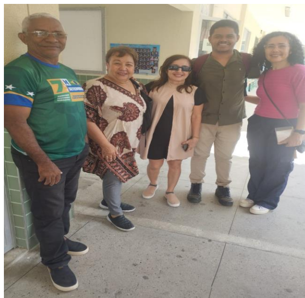
Figura 11 - Horta escolar da escola Olímpio Nogueira Lopes

Outro importante momento de troca de experiências pode ser visualizado na figura 12, que ilustra a visita de um grupo composto pela pesquisadora, orientadora e mais dois pesquisadores, vinculados ao PPPGE-UECE e ao curso de agronomia da UNILAB.