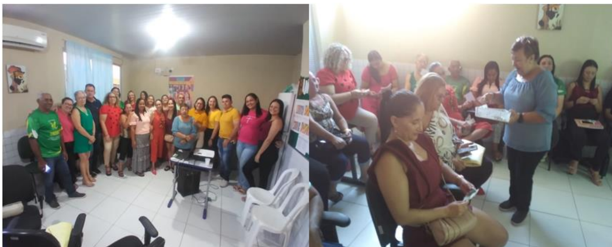
Figura 08 - Apresentação do projeto de pesquisa

A figura 08 retrata a apresentação do projeto de pesquisa durante o encontro pedagógico com os docentes. Observamos o grande interesse e receptividade em relação ao projeto, além de uma postura bastante amistosa. Foi um momento extremamente enriquecedor, repleto de partilhas e aprendizagens significativas.