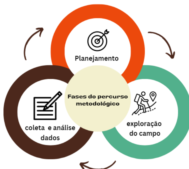
Figura 1 - Fases do estudo de caso etnográfico

A figura 1 apresenta o percurso metodológico da pesquisa do tipo estudo de caso etnográfico (ECE).