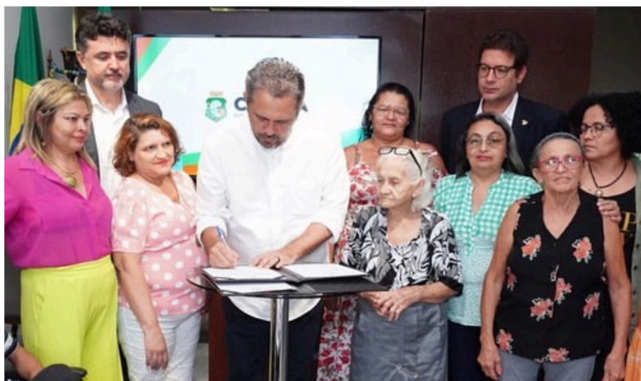
Figura 9 – Diálogo com o Governo do Estado do Ceará