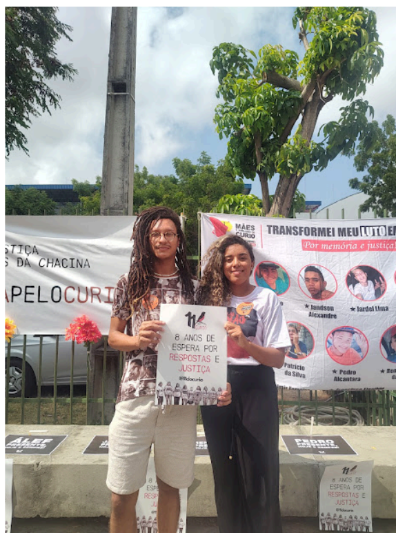
Figura 13 – Júri do Curió 2023, Fórum Clóvis Beviláqua