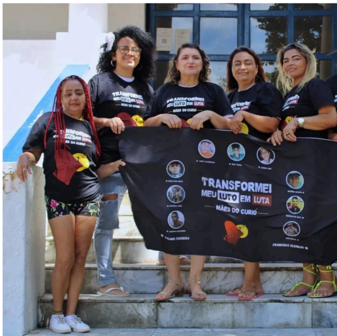
Figura 16 – Dia da Beleza - Mães do Curió