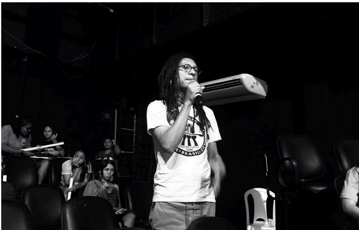
Figura 8 – Semana Cada Vida Importa 2022, Centro Cultural do Bom Jardim (CCBJ)