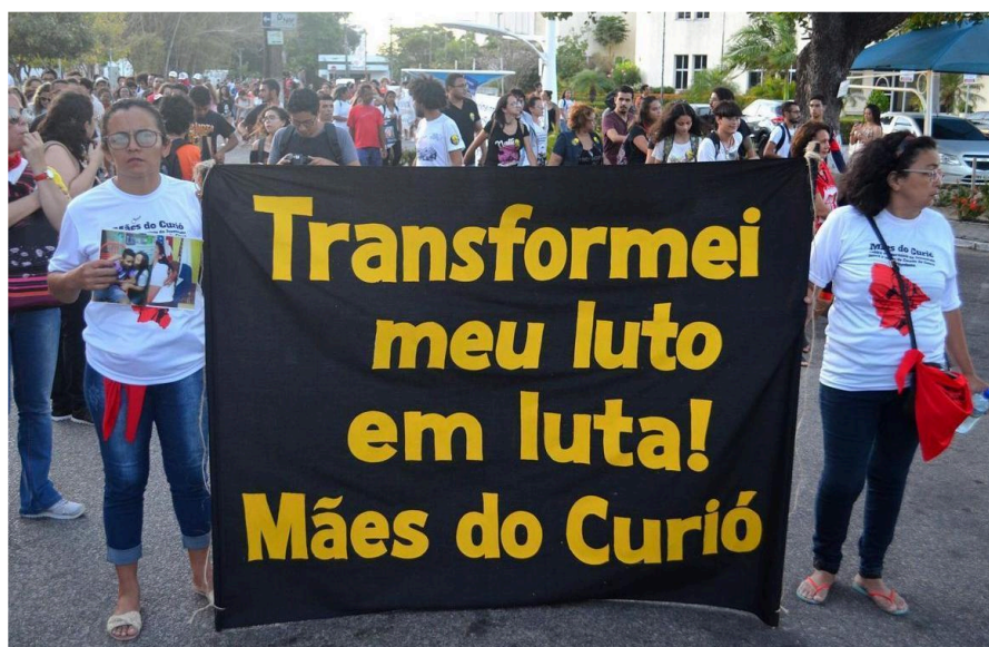
Figura 5 – Marcha da Periferia, 2018