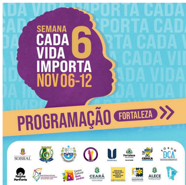
Figura 7 – Semana Cada Vida Importa 2022 (2)