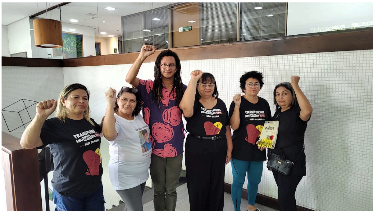
Figura 10 – Júri do Curió