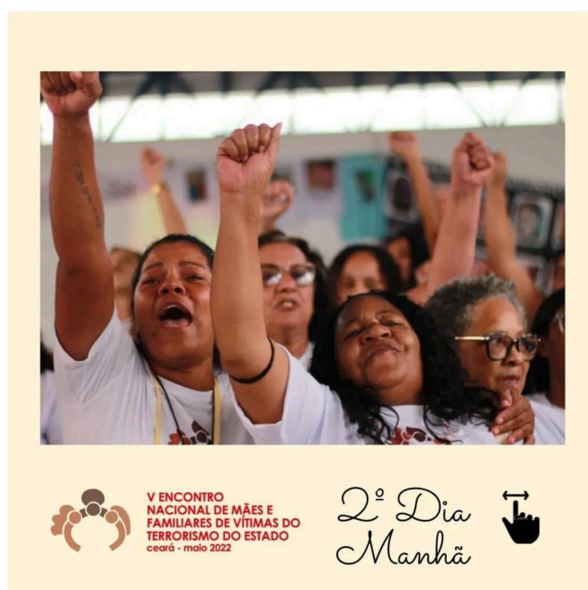
Figura 3 – Travessia, 2º dia – V Encontro Nacional de Mães e Familiares de Vítimas do Terrorismo de Estado

foram! Nós, as mães desse Estado violento e violador, desejamos anunciar para a sociedade e para as autoridades quem em maio não há nada para se comemorar, que o comércio compreenda a nossa dor quando ao oferecer seus produtos saibam que nem temos filhos(as) junto a nós, pois os(as) que não foram assassinados(as) estão sob confinamento do cárcere. Desejamos atravessar as ruas do Centro clamando por uma outra paz, que não seja a paz do Governador Camilo Santana com a tal paz do Ceará Pacífico, onde nossa juventude, logo nossos filhos, tanto morre. (Coletivo Vozes, Facebook, 2019).