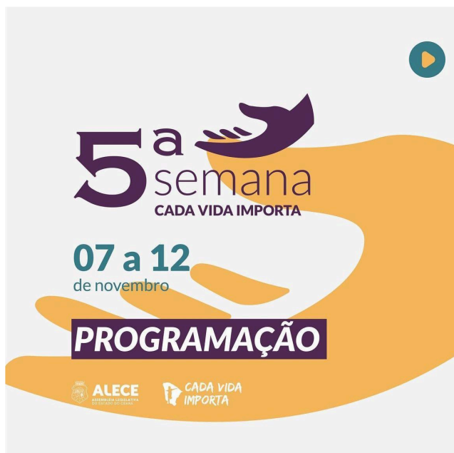
Figura 6 – Semana Cada Vida Importa 2022 (1)