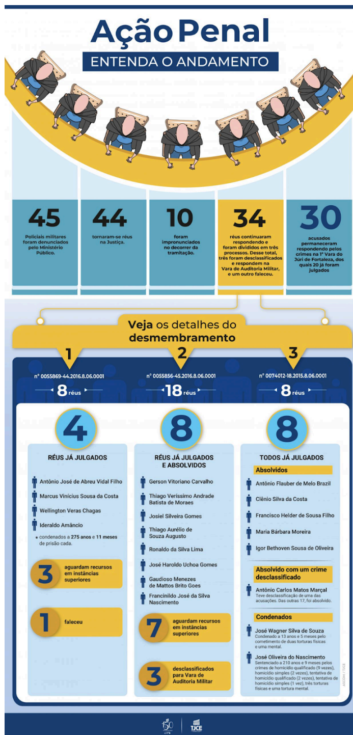
Figura 27– Detalhes da Ação Penal