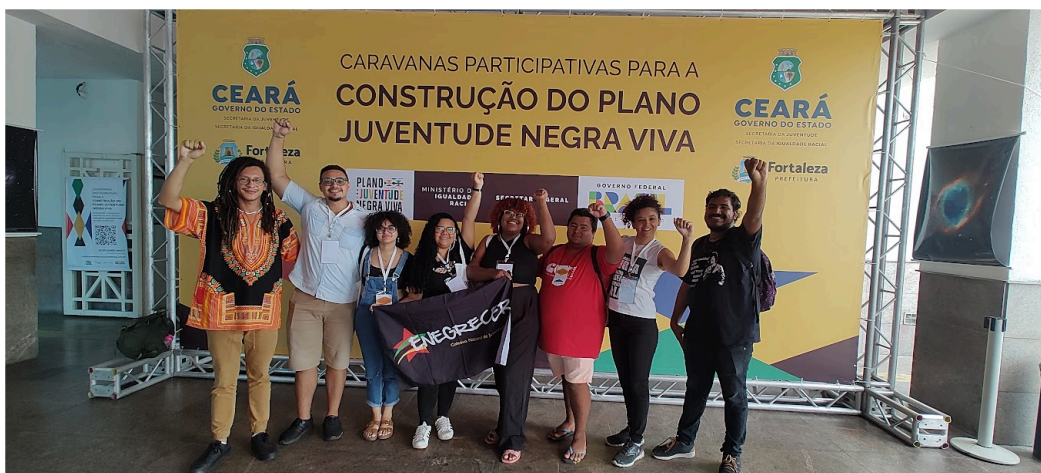
Figura 17 – Construção do Plano Juventude Negra Viva no Ceará, 2023

O Plano Juventude Negra Viva representa, em certa medida, a capacidade dos movimentos sociais de impactar a agenda governamental, ainda que de forma parcial e intermitente. A participação das Mães do Curió e de movimentos similares nas Caravanas Participativas do Plano é expressão desse potencial. Contudo, a descontinuidade do Plano entre 2016 e 2023 evidencia a fragilidade das conquistas quando dependentes da vontade política de governos específicos. A luta dessas mães opera, portanto, em dois registros simultâneos: o da denúncia, expor o que o Estado faz, e o da proposição, construir o que o Estado deveria fazer. Essa dupla atuação é uma marca característica dos movimentos de mães e familiares de vítimas da violência estatal ao redor do mundo.