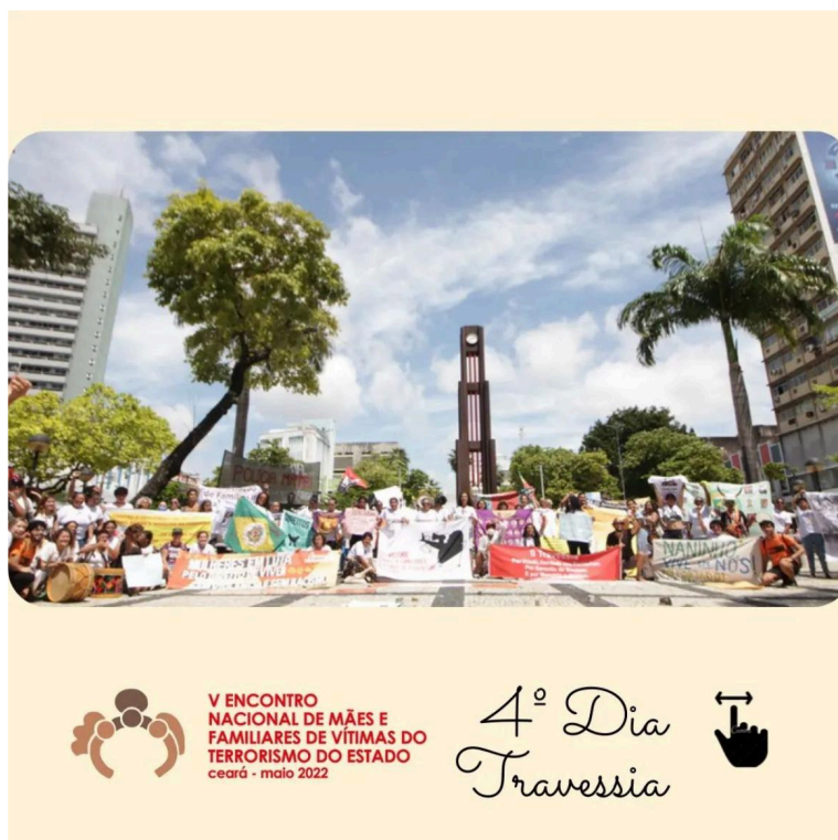
Figura 4 – Travessia, 4º dia – V Encontro Nacional de Mães e Familiares de Vítimas do Terrorismo de Estado