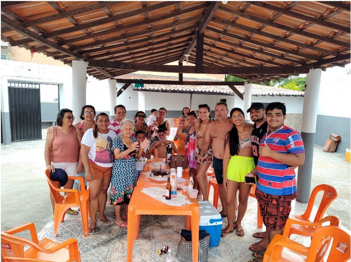
Figura 25 – Confraternização com as Mães do Curió (3)