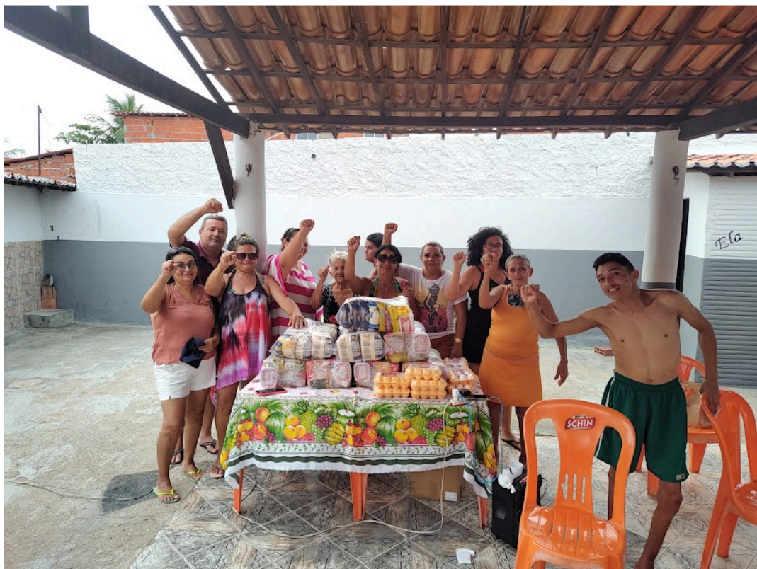
Figura 24 – Confraternização com as Mães do Curió (2)