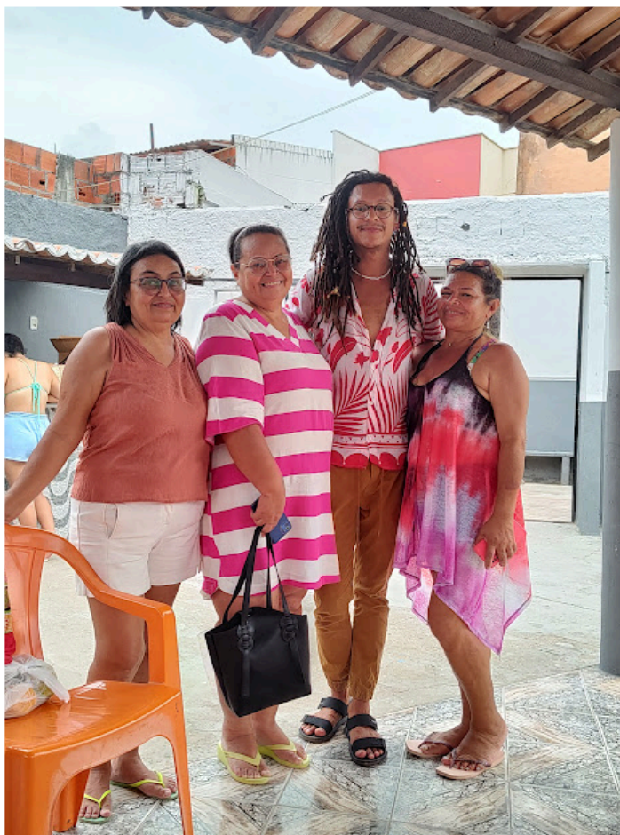
Figura 22 – Confraternização com as Mães do Curió