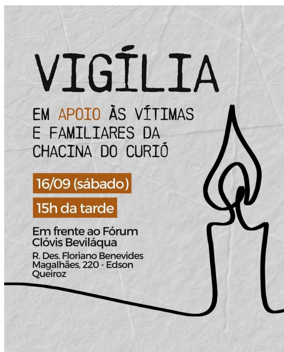
Figura 12 – Vigília em apoio às vítimas e familiares da Chacina do Curió