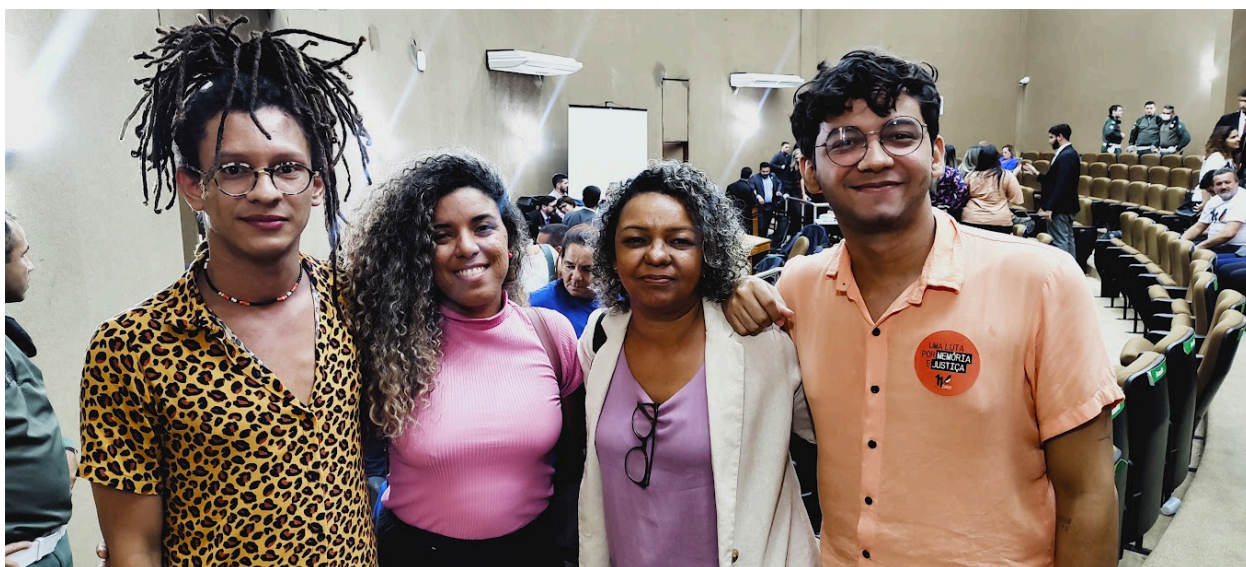
Figura 15 – Presença do Movimento Negro Unificado (MNU) acompanhando o Júri do Curió 2023, Fórum Clóvis Beviláqua