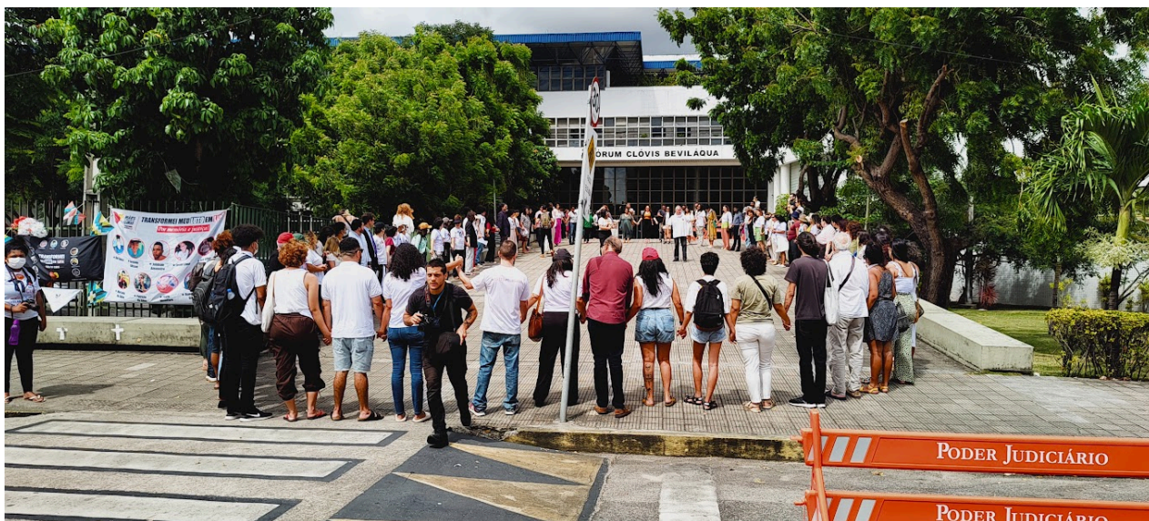
Figura 14 – Vigília do Júri do Curió 2023, Fórum Clóvis Beviláqua