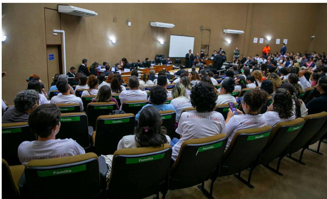
Figura 26 – Imagem do Júri do Curió