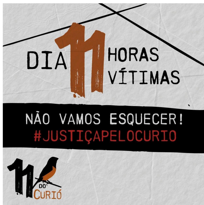
Figura 11 – 11 do Curió