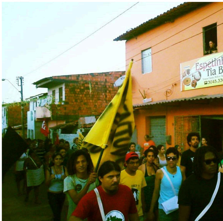
Figura 1 – Marcha da Periferia 2015, Serrinha - Fortaleza (CE)